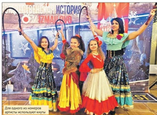
Для одного из номеров артисты используют кнуты

Руководитель студии добавила, что с этими танцами коллектив уже неоднократно завоёвывал первые места.